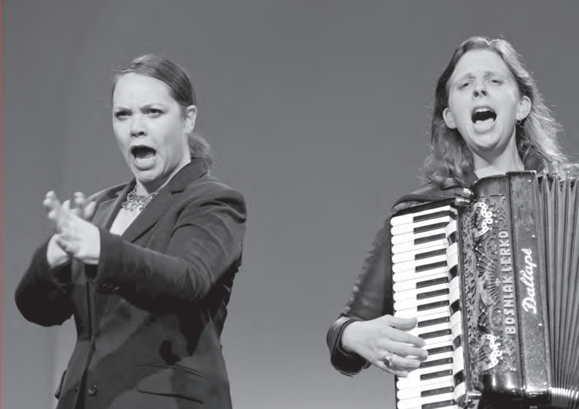
Knuth & Tucek: Neurotikon