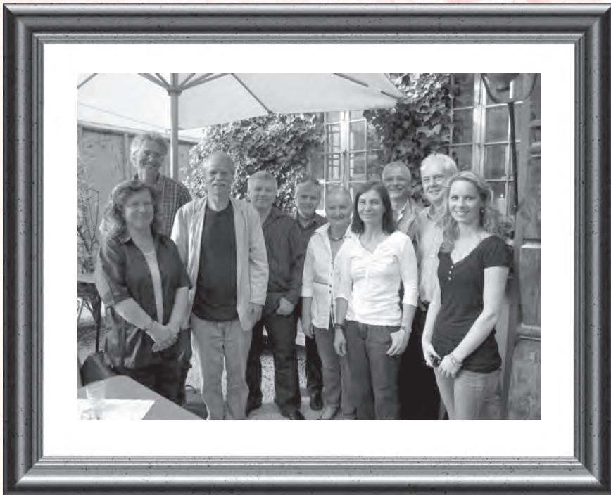
Jubilareinnen und Jubilare anlässlich der Feier im Grotto101313 in Luzern