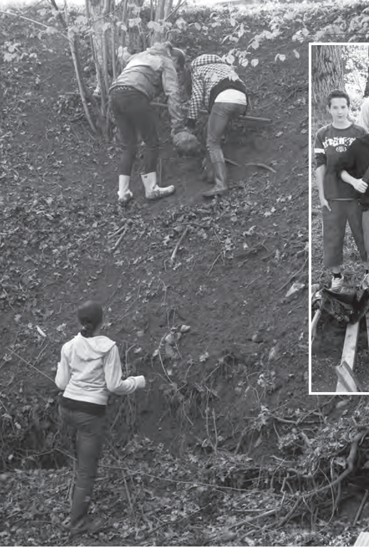
Schwerkraft: Das Herausziehen des Mülls erforderte häufig vollen Körpereinsatz.