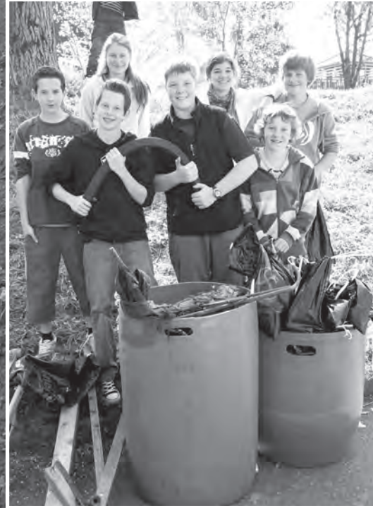
Trophäen: Ein Teil einer Schulklasse präsentiert den von ihnen gesammelten Abfall.