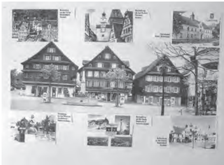
Sieben Städte treffen sich grenzübergreifend

der sechs Rothenburg werden auch Teams aus unserer Gemeinde treffen. In folgenden Sportarten wird am Samstag um gute Positionen gekämpft: Fussball, Handball, Tischtennis, Volleyball und Schiessen. Anfeuerungsrufe werden gewiss Leistung und Motivation zusätzlich anheizen. Wer wird wohl am Samstagabend den Turnierpokal in Empfang nehmen können?